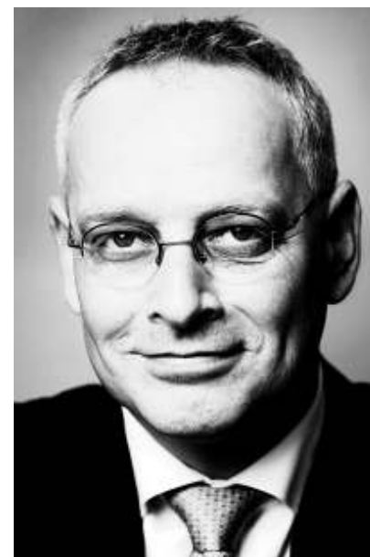
SPRUYT ...innerlijke versterking...

het jammer dat klederdrachten verdwenen, dat de traditionele kleine ramen in Veluwe boerderijen plaats maakten voor door hem verfoeide „etalageruiten” en hij verzette zich met hand en tand tegen de toelating van lokale coöperaties.